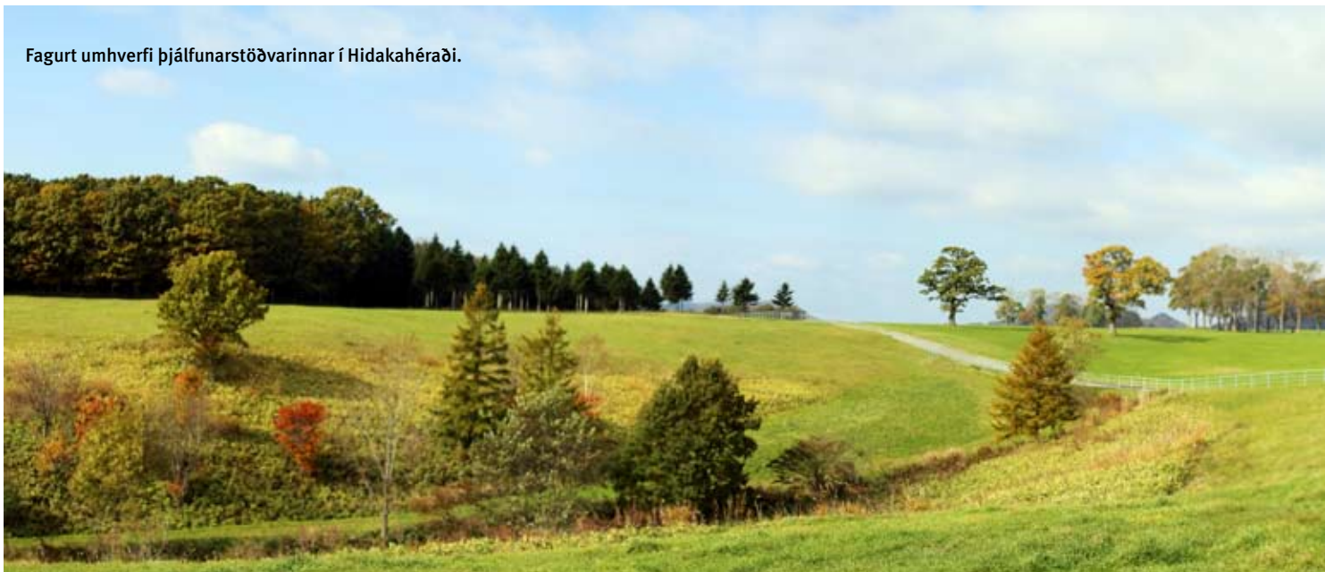
Fagurt umhverfi þjálfunarstöðvarinnar í Hidakahéraði.

Eitt hlaup er hápunktur ársins, hið svonefnda Ban'ei Kinen . Þar draga hrossin sleða sem er tonn að þyngd, og eru 5 milljón jen í sigurlaun. Það hross sem á metið í þessu erfiðasta hlaupi heitir Nishiki Daijin. Hann var 2:34 mínútur þessa 200 metra árið 2012. En hann vann einnig árið 2010, þá á 4:24.8 mínútum, og gefur það hugmynd um hve misjöfn hlaupin geta verið.