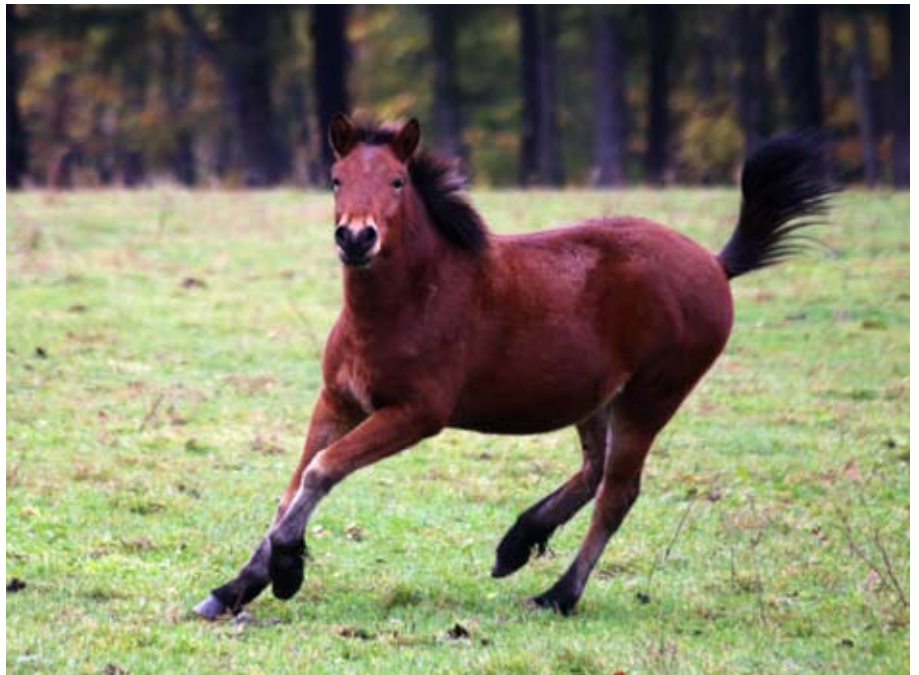
Hokkaidoungrossin létu ekki sitt eftir liggja við að sýna sig svolítið.

Hokkaidohesturinn er nokkuð svipaður útlits og íslensk hross af gamla skólanum, til þess að gera, lítt breyttur ásjár frá mongólska villihestinum, og ekki laust við að Íslendingshjartað í brjósti manns bærisk við svo kunnuglega sýn sem marglitt stóð hrossa á ýmsum aldri í víðfeðmu frjálsræði. Þó er ýmist sem í milli ber, til að mynda er fax og tagl mun fingerðara, og sterturinn