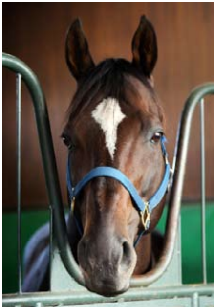
Veðreiðagraðhesturinn Empire Maker, sem vann tæplega 2 milljónir Bandaríkjadala í sigurlaun, og hafði sigurinn af geldingnum Funny Cide í Belmont Stakes-hlaupinu árið 2003. Funny Cide hafði þá unnið bæði Kentucky Derby og Preakness Stakes-hlaupin, en þessi þrjú hlaup eru hápunktur veðreiðaársins, og þykir mikils um vert að vinna öll þrjú hlaupin, en það hefur ekki gerst síðan 1978.