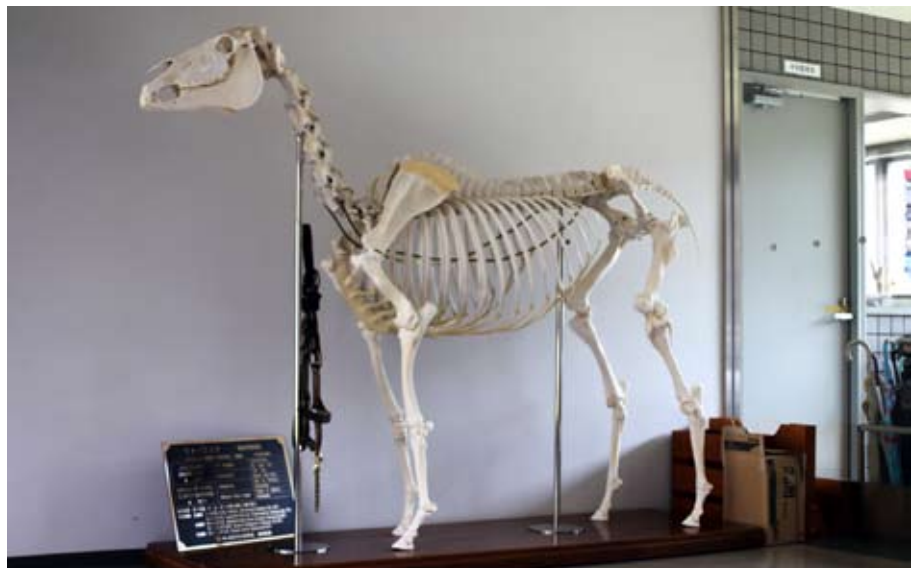
Beinagrind veðreiðahestsins Warning sem var talinn besti tvævetra folinn í Evrópu árið 1987, og besti veðreiðahestur Evrópu árið eftir.