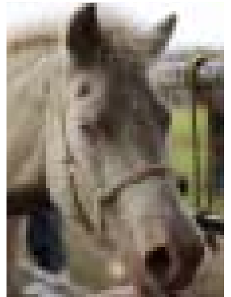
Föl Hokkaidohryssa bíður þess yfirveguð að vera vegin.