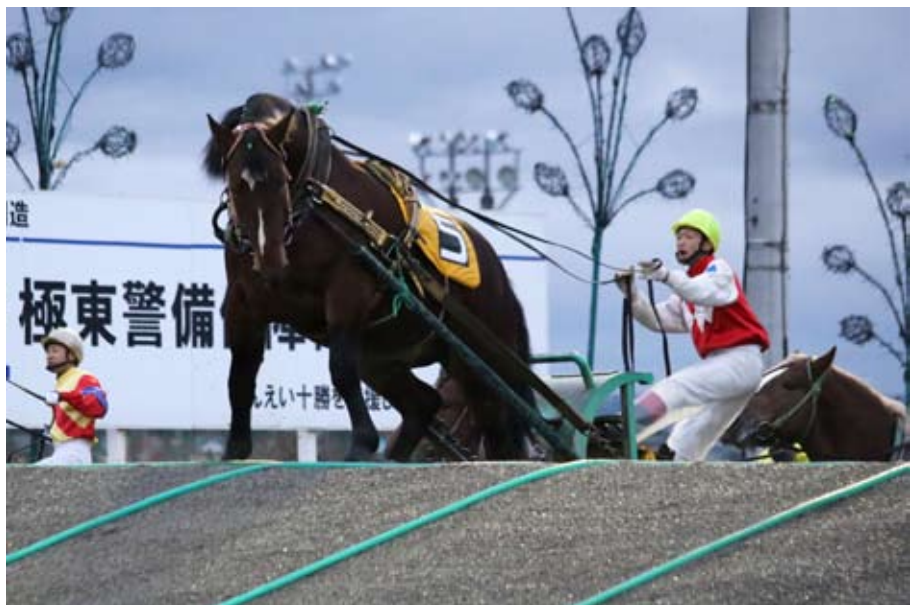
Það getur tekið á að komast yfir síðari hlaupaþúfunu í Ban'ei veðhlaupunum.

Þá var komið við á stóðhestastöð þar sem boðið er upp á fremstu og fræknustu