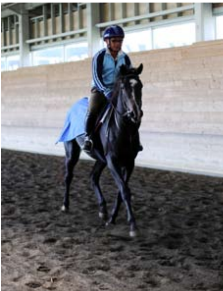
Alvara lífsins byrjar snemma hjá veðreiðahestunum, yfirleitt um 18 mánaða aldur.