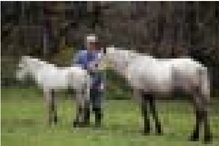
Þrátt fyrir hlaup og galsa, þá eru Hokkaidohrossin spök. Svo er gaman að sjá að eins og hefð var áður fyrr á Íslandi, þá taglskella sumir bændur sín hross.