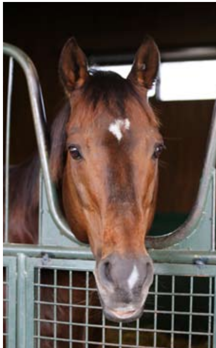
Veðreiðagraðhesturinn Boston Harbor, sem einnig vann tæplega 2 milljónir Bandaríkjadala í sigurlaun, en einungis á einu ári sem tvævetrungur árið 1996, og setti þar með nýtt met sem stendur enn.