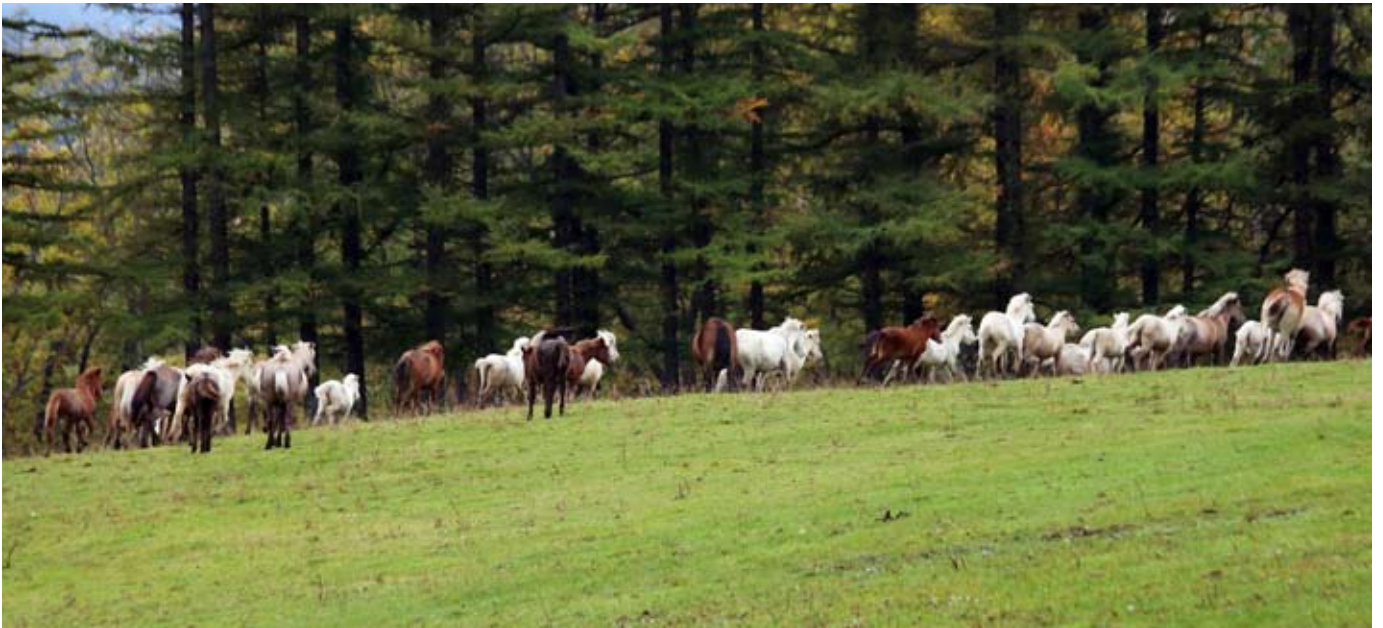
Stóð Hokkaidohrossa tekur á rás í galsa.