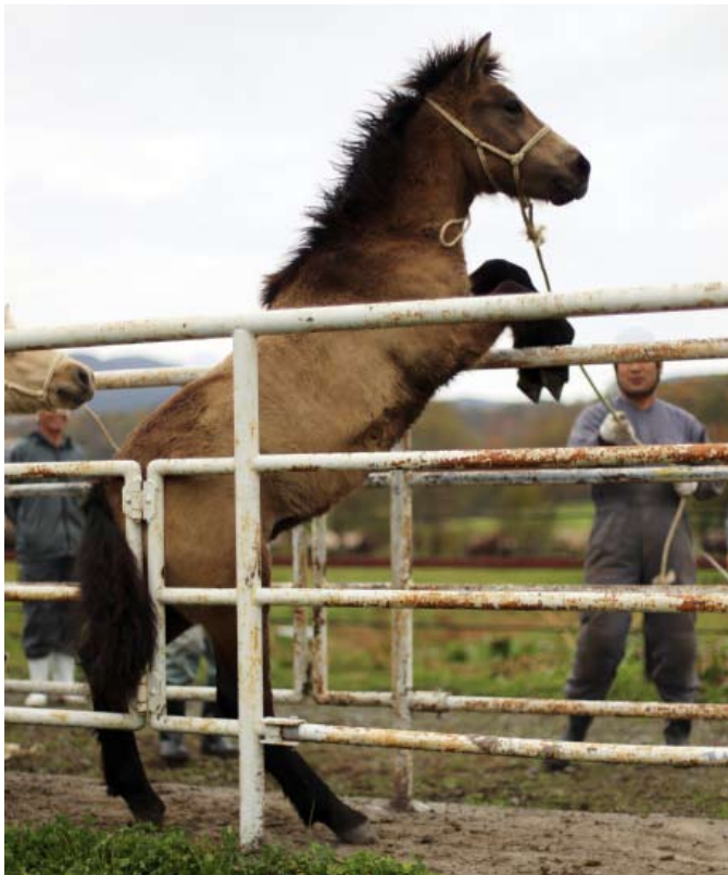
Eins og eigendur stórra stóða kannast við, þá getur verið handgangur í öskjunni þegar folöldin koma í rennuna. Þó hafðist það að fá hvert eitt og einasta til að standa kyrrt á stórgripavoginni við enda rennunnar.